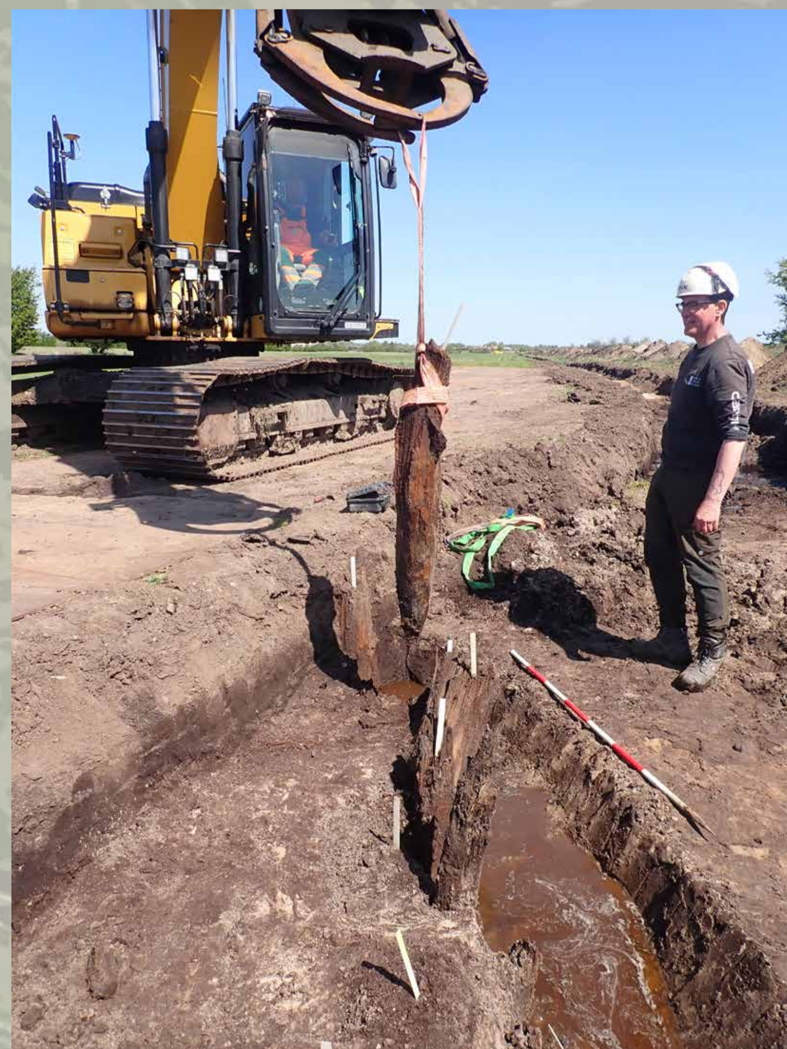
En nedrammet stolpe fra Uge Mark trækkes op.