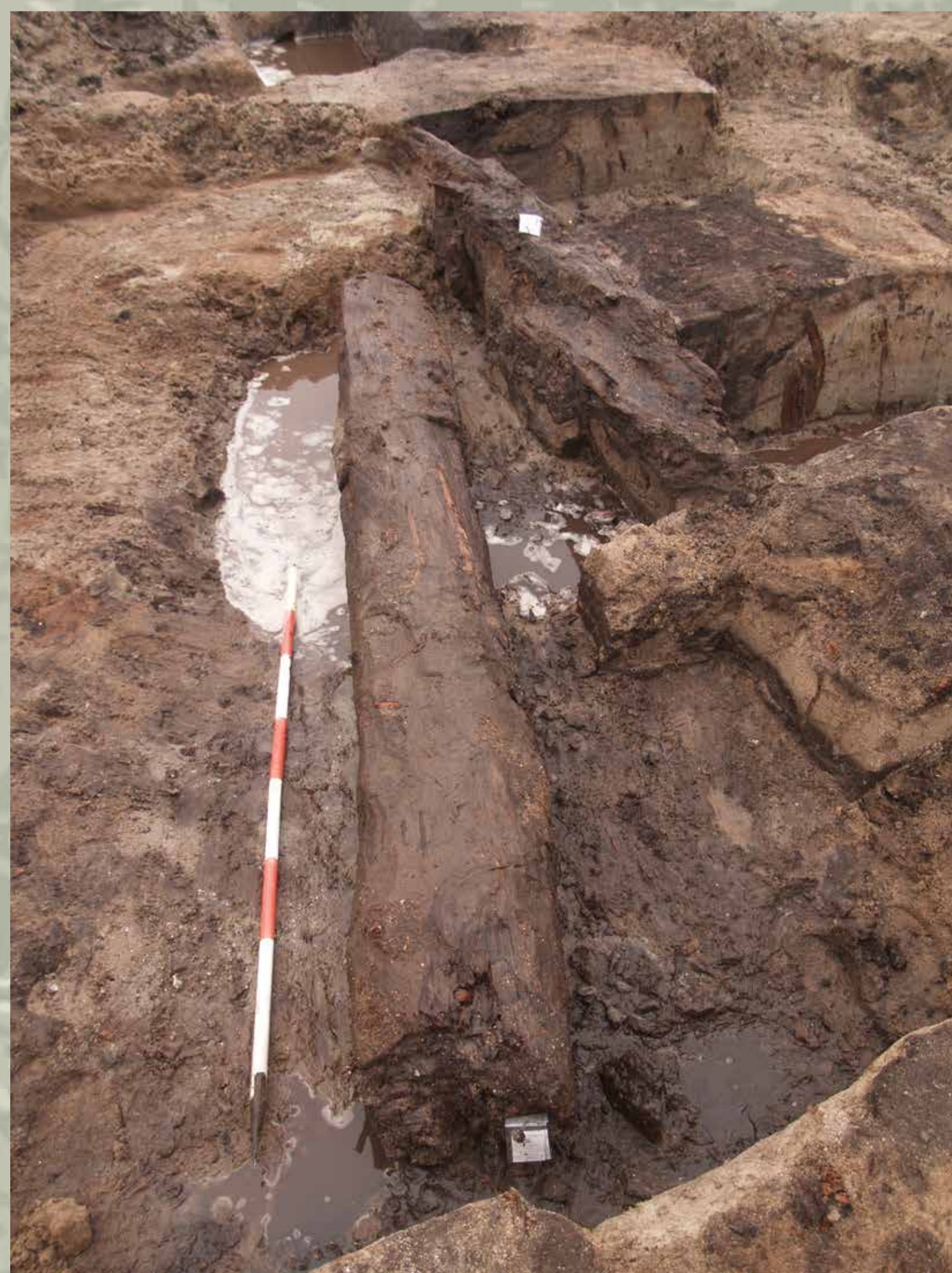
En hel stolpe fra voldgraven ved Bjerndrupvej

Stolperne til Olgerdiget er omhyggeligt tilpasset afhængig af det sted, de skulle stå. Ved Bjerndrupvej (øverst) er stolperne sat i en palisadegrøft. Derfor er bunden flad og afrettet med økse, så stolperne kunne stå lodret. Siderne er affasede, så stolperne kunne stå tæt som i et plankeværk. Ved Uge Mark (nederst) er bunden blød. Her skulle stolperne nedrammes. Derfor er de tilspidsede med øksehug. For en præcis placering er der lavet en ekstra lille spids, som gjorde, at stolpen blev, hvor den var sat, når man startede på nedramningen.