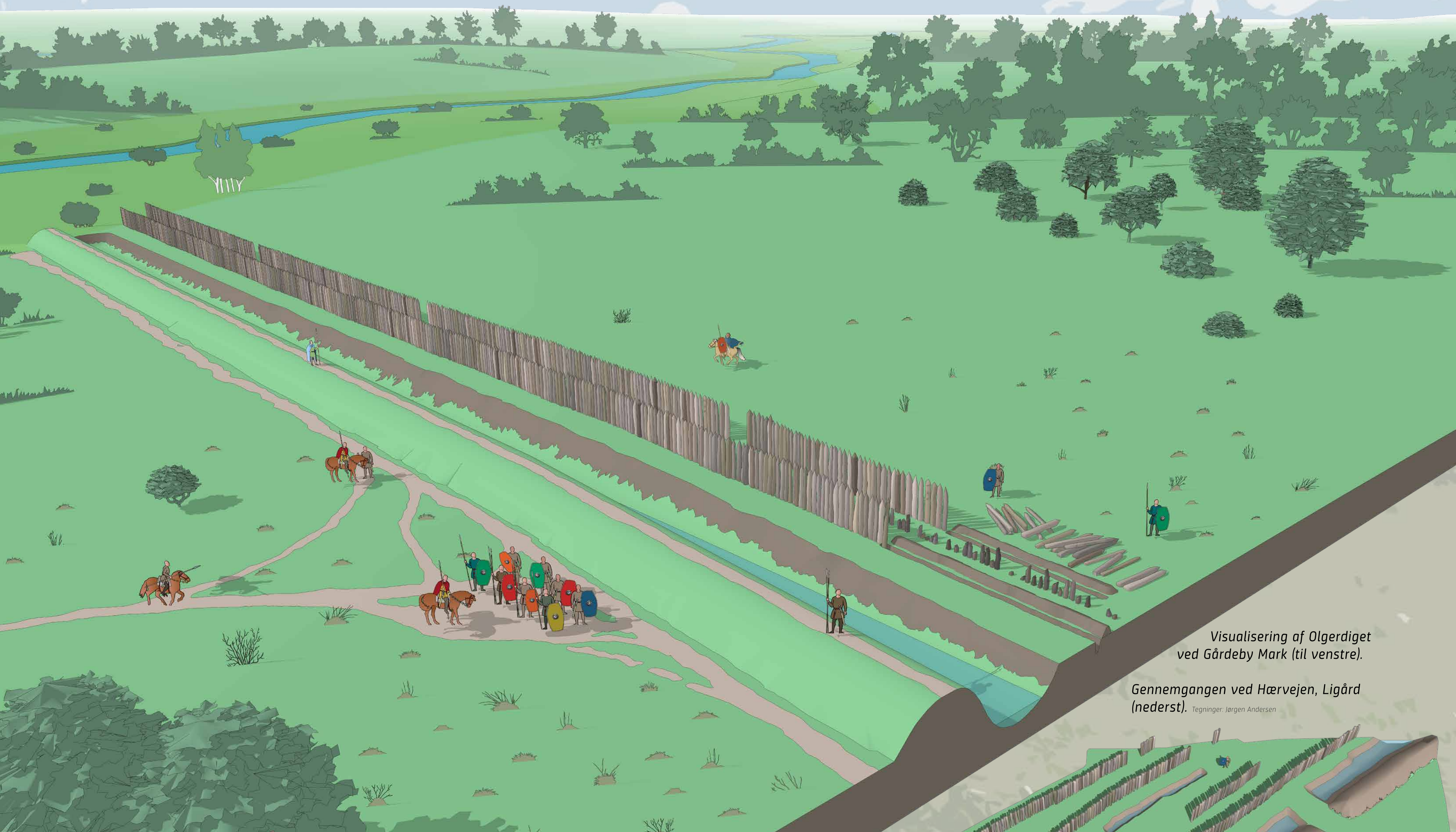
Visualisering af Olgerdiget ved Gårdeby Mark (til venstre).