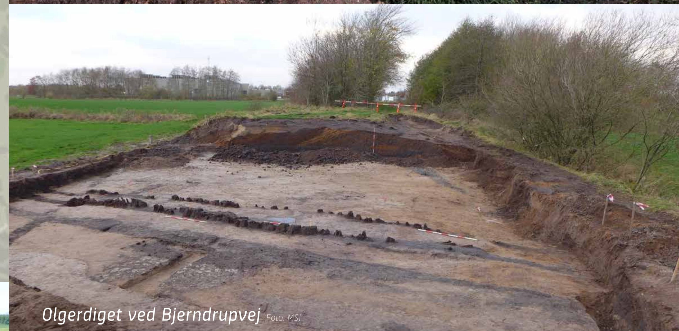
Olgerdiget ved Bjerndrupvej