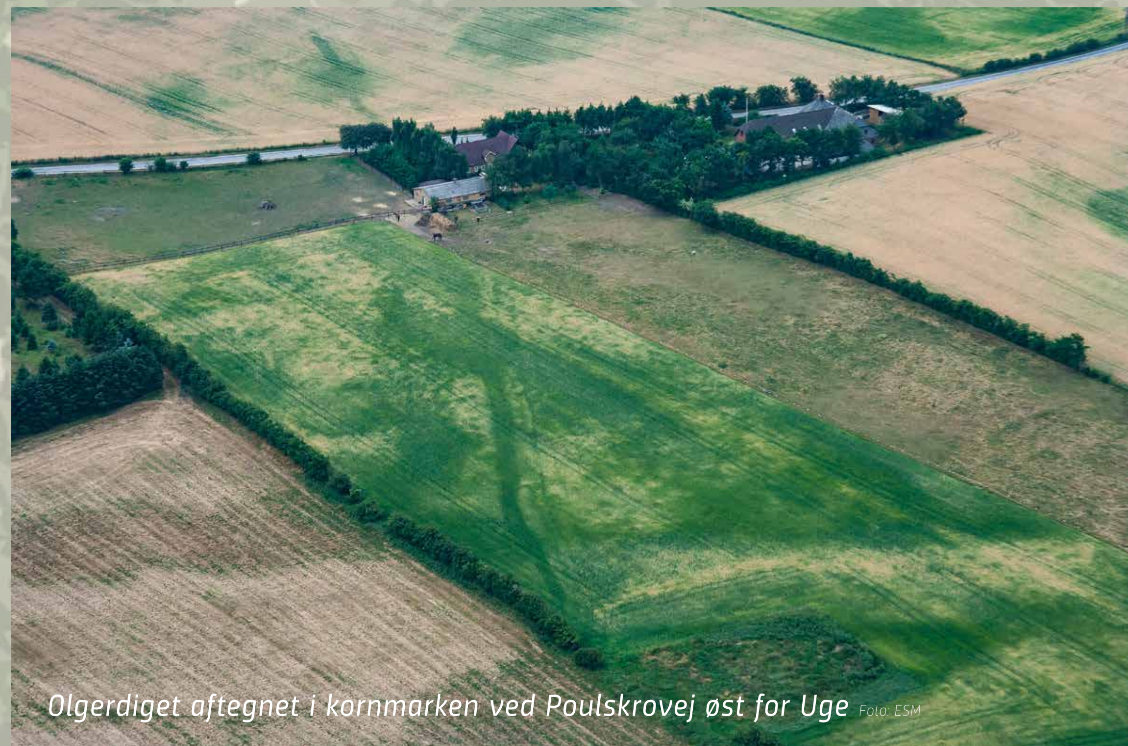
Olgerdiget aftegnet i kornmarken ved Poulskrovej øst for Uge