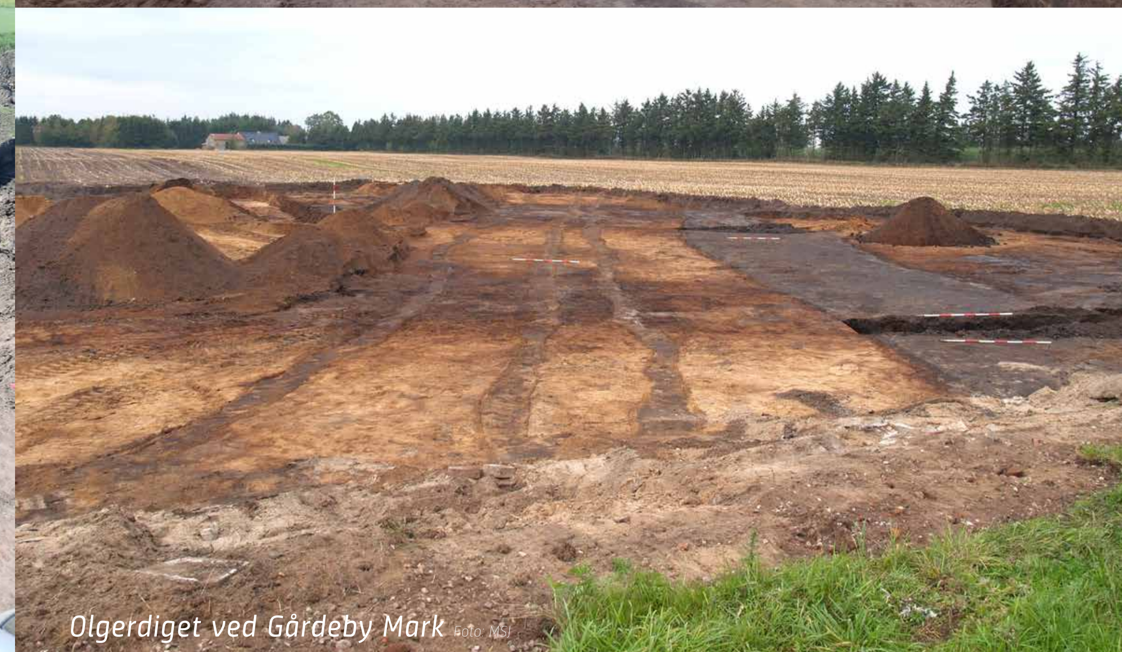
Olgerdiget ved Gårdeby Mark