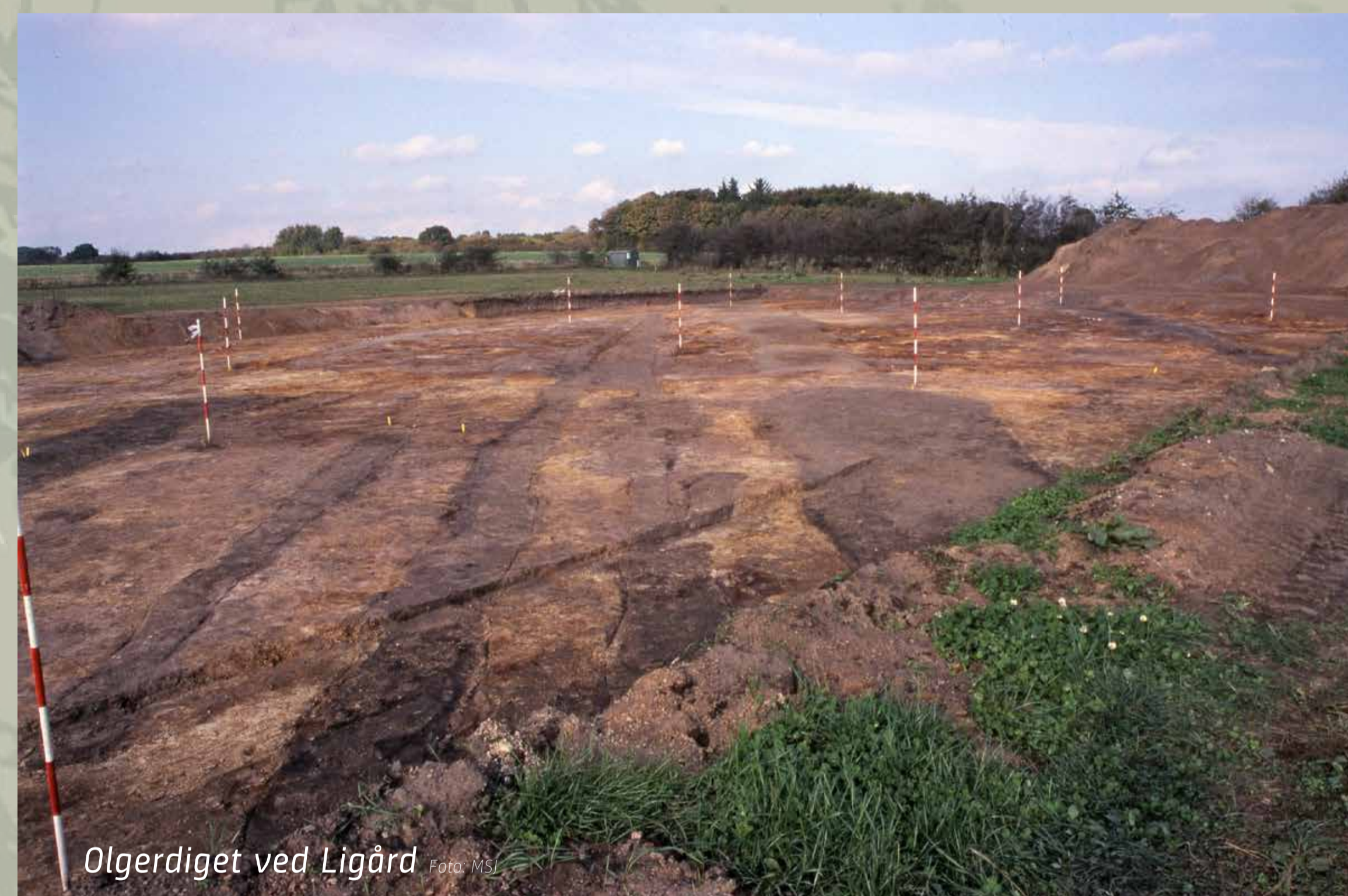
Olgerdiget ved Ligård

Sammen med to samtidige ringvolde – Archsumburg på Sild og Trælbanke nord for Højer – udgjorde Olgerdiget en form for grænse mellem anglernes stammeområde mod syd og varinernes mod nord.