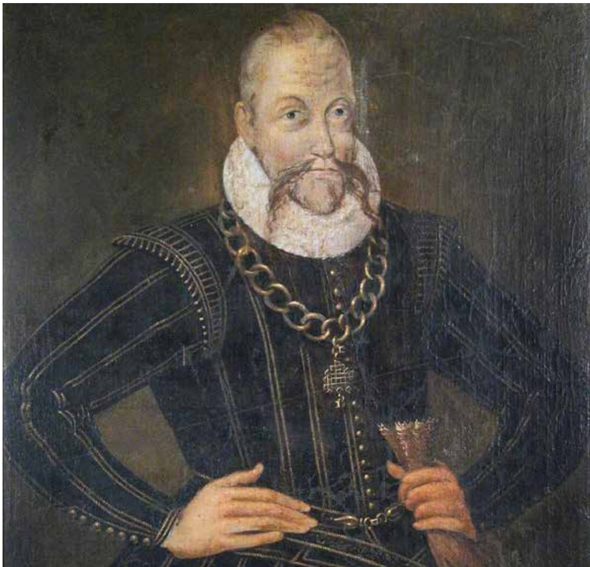
Hertug Hans den Yngre (1542-1622), ukendt maler og udateret, formentlig slutningen af 1500-tallet