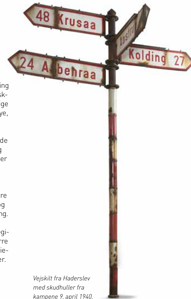
Vejskilt fra Haderslev med skudhuller fra kampene 9. april 1940.

Museets forskning kvalitetsbedømmes af eksterne parter som meget tilfredsstillende SLKS' kvalitetsvurdering ultimo 2015.