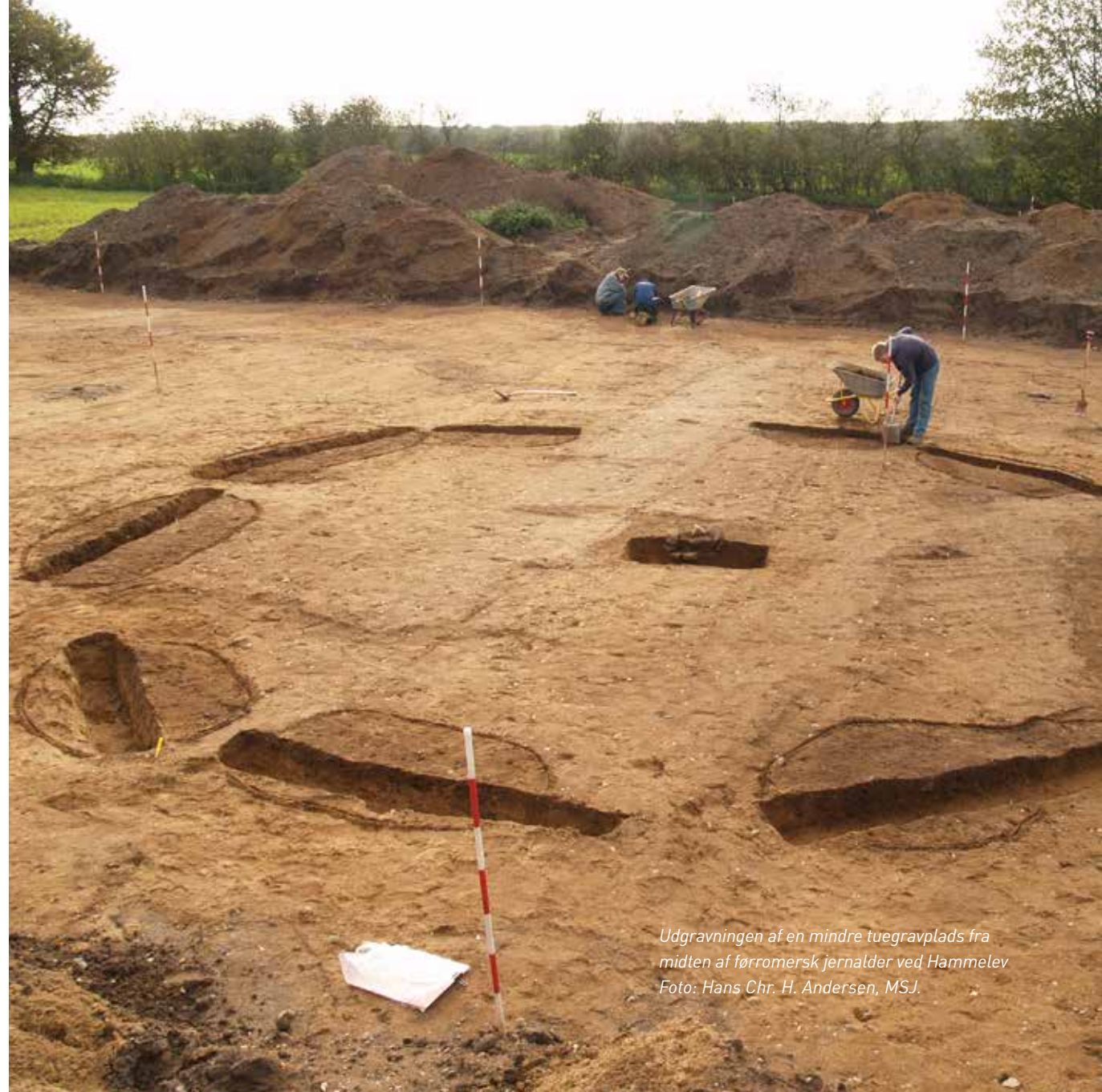
Udgravningen af en mindre tuegravplads fra midten af førromersk jernalder ved Hammelev

I forbindelse med denne revision peges på ét eller flere større projekter, som søges gennemført i resten af programperioden.