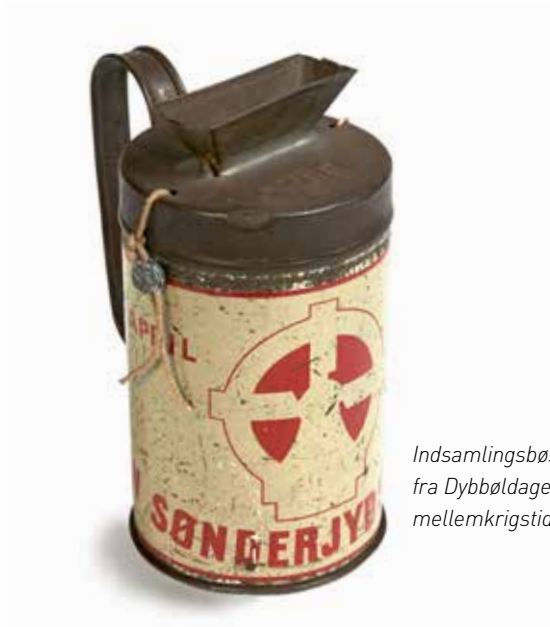
Indsamlingsbøsse fra Dybbøldagen, mellemligstiden.

Museets forskende personale forventes at skulle benytte det af universiteterne anvendte system PURE til registrering af deres forskningsaktiviteter m.v. Det er forskningsudvalgets opgave i løbet af 2021 at indkredse behovet for licenser til PURE mhp. at tilkøbe adgang til systemet og i det hele taget at undersøge muligheden for implementering af PURE fra 2022.