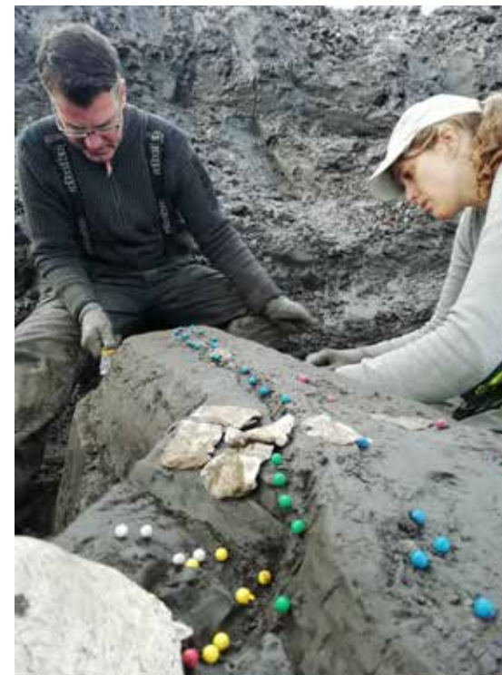
Udgravning af hvalfund fra 2018.

Der har i de seneste år på tværs af discipliner som fx kulturstudier, arkæologi, kunsthistorie og designhistorie været et øget fokus på begrebet ’materialitet’. Dette er sket i behovet for at finde nye tilgange til at det, der omgiver os sanseligt, taktilt og fysisk. Vil man forstå mennesker, er det ikke nok udelukkende at høre på, hvad de siger eller har skrevet ned. Man bliver også nødt til at forstå den materielle verden og kultur, de omgiver sig med. Denne materialitet kan både være betinget af natur og steder, men den er i høj grad forankret i de genstande, mennesket til forskellige tider og på forskellige steder har brugt til at forme og udtrykke sig selv, sin historie, sin religiøsitet og sin kultur igennem.